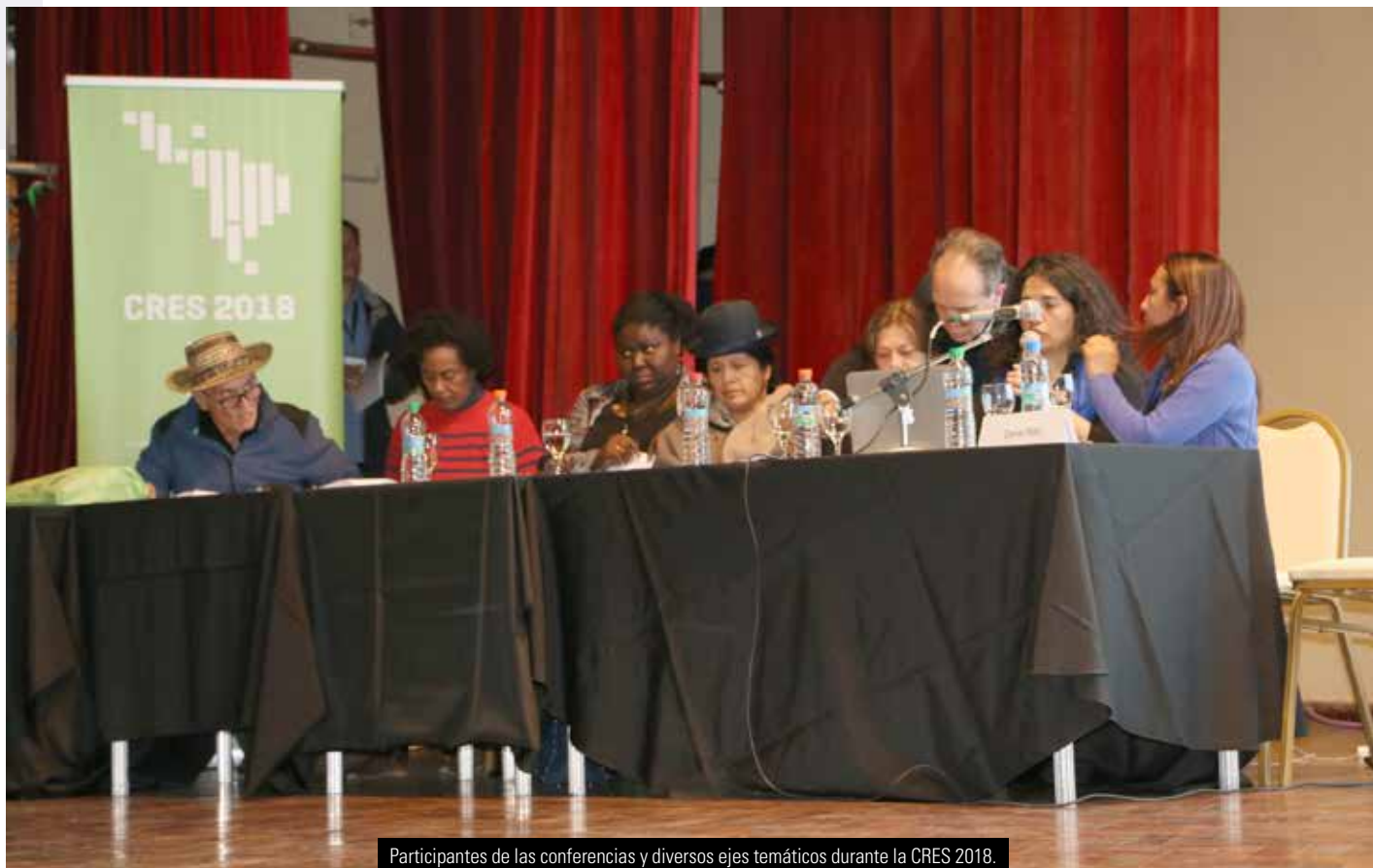
Participantes de las conferencias y diversos ejes temáticos durante la CRES 2018.